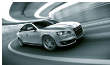
Asuransi Kendaraan Bermotor Syariah

Produk pilihan untuk memenuhi kebutuhan Anda dalam berasuransi secara syariah: