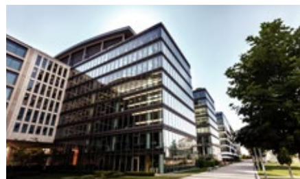
Asuransi Harta Benda Syariah